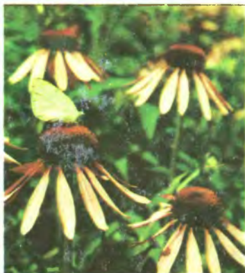
428. Ехінацея пурпурова.